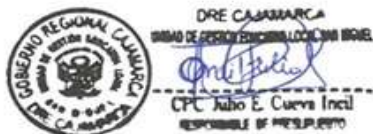
Sello y Firma del Responsable de PPTO

En señal de conformidad se procede a firmar el Acta en original y tres (03) copias siendo las 10.28 a.m. del día 08 de febrero del 2024.